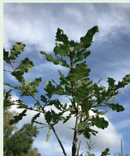
fol. E. Budka

Celem planu zalesienia jest wyposażenie rolnika w fachową informację na temat wykonania zalesienia oraz zabiegów pielęgnacyjnych na założonej uprawie leśnej lub gruntach z sukcesją naturalną, które mają być wykonywane przez 5 lat. Plan zalesienia sporządzany jest oddzielnie dla każdego kompleksu obejmującego grunty przeznaczone do wykonania zalesienia lub grunty z sukcesją naturalną i powinien zawierać podpis nadleśniczego, który sporządził ten plan. Jego egzemplarz powinien być przechowywany u rolnika, a kopia w Nadleśnictwie. Ponadto, kopia planu zalesienia (potwierdzona za zgodność z oryginałem przez nadleśniczego, który sporządził ten plan) dołączana jest do wniosku o przyznanie wsparcia na zalesienie lub do wniosku o przyznanie pierwszej premii pielęgnacyjnej do gruntów z sukcesją naturalną na których, zgodnie z planem zalesienia nie jest wymagane dolesienie.